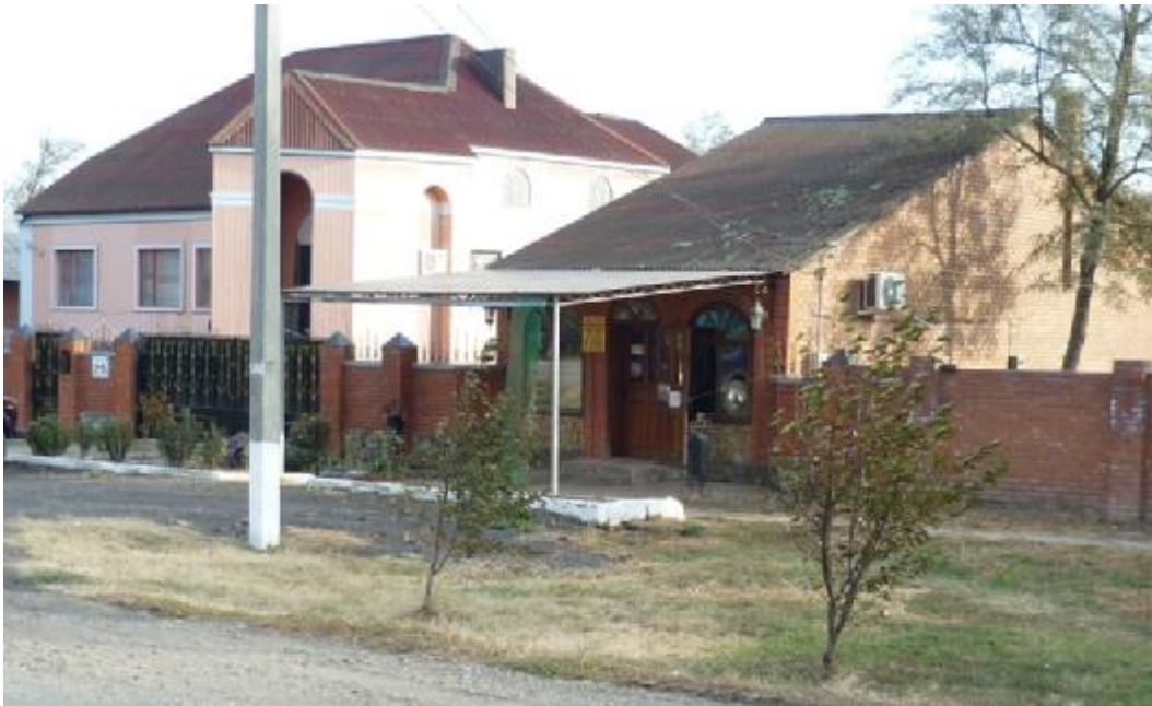
Добротные дома строят в станице Плоской

Я бывал в этом хозяйстве много раз и всегда поражался образцовому порядку на его территории. Благоухающие зеленью и цветами клумбы у административного здания. Побелённые деревья. Удобные, оснащённые современной мебелью и офисным оборудованием кабинеты. Ухоженные и снаружи, и внутри производственные и подсобные помещения. Хорошие условия для размещения и хранения тракторов, автомобилей, комбайнов и другой техники. Удобные для проезда даже легковых автомобилей грунтовые полевые дороги (без ям и колдобин). Великолепная столовая со всем необходимым оборудованием... Однако рассказ об этом хозяйстве – это уже совсем другая, современная история, не имеющая к выведенному в название статьи событию никакого отношения.