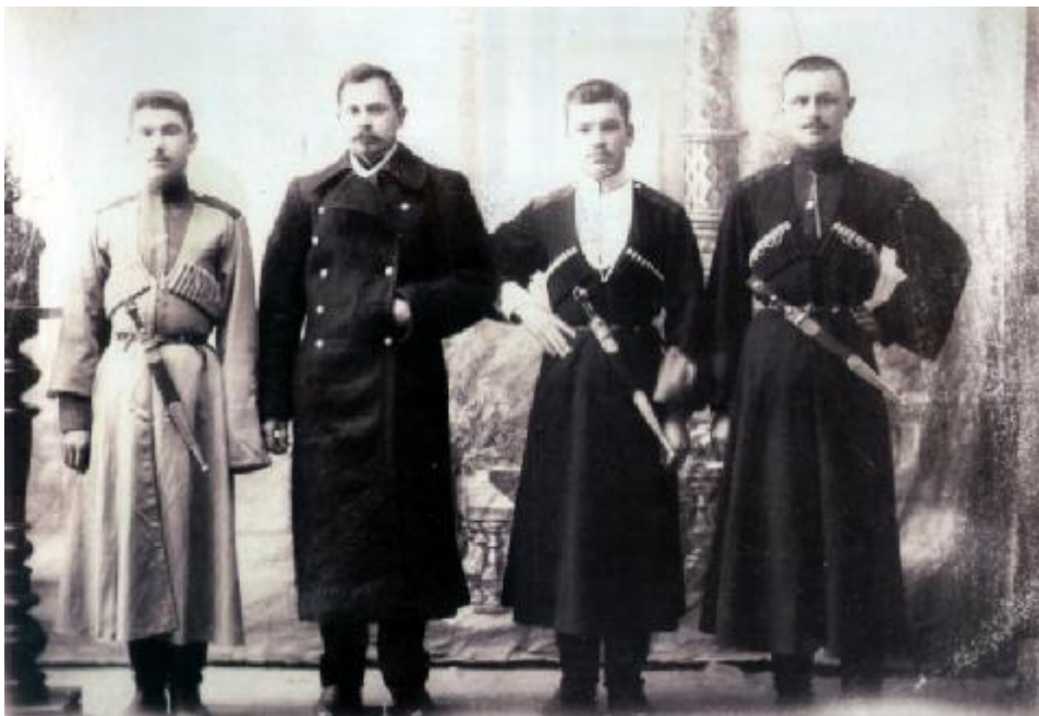
Братья Ерёменко из ст. Плоской. 1914 год

На жалобу хуторян была дана, по сути, бюрократическая отписка. Но их послание всё же переслали военному министру. 29 апреля 1916 года казачий отдел Главного штаба направил его начальнику штаба Кавказского военного округа. Изложив суть дела, Главный штаб постановил: "Всё земельное довольствие, отведённое обществу станицы Старокорсунской, как при месте её поселения, так и в дополнительных наделах, распределить между обществами последней и хутора Старокорсунского пропорционально народонаселению мужского пола...".